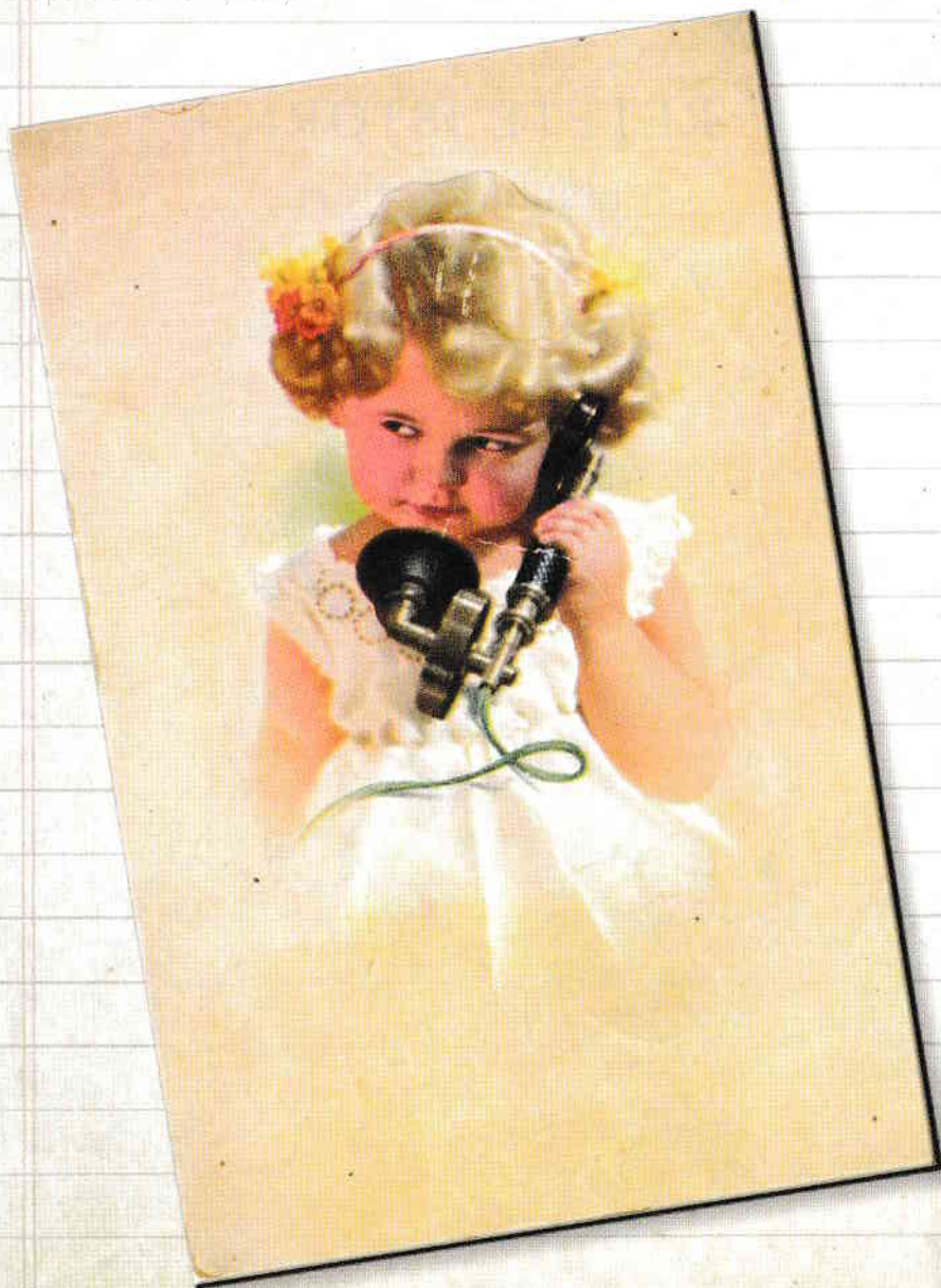
Carte poștală circulată în România, anul 1926